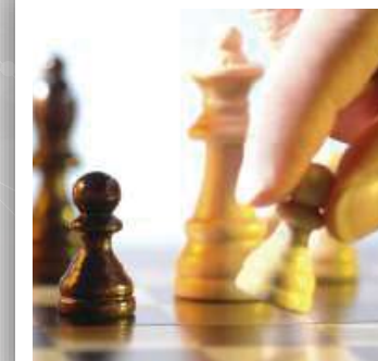
Estrategias de Inversión