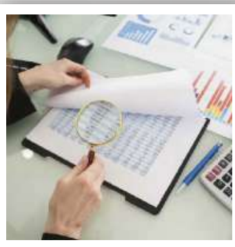
Valorización de Empresas