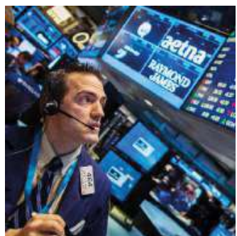
Bolsa de Valores Lima y New York