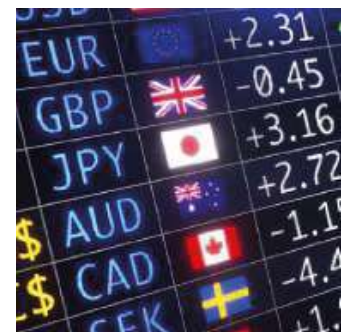
Mercado de Divisas